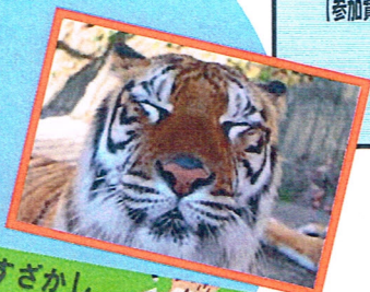
すざかし どうぶつえん SUZAKA ZOO

須坂市方面に行きました。午前中にミニチュア電車を見学し、午後は動物園へ行きました！