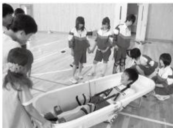
高齢者疑似体験授業

市内6つの小・中学校、高等学校の福祉教育の推進を支援することを目的に実施しています。