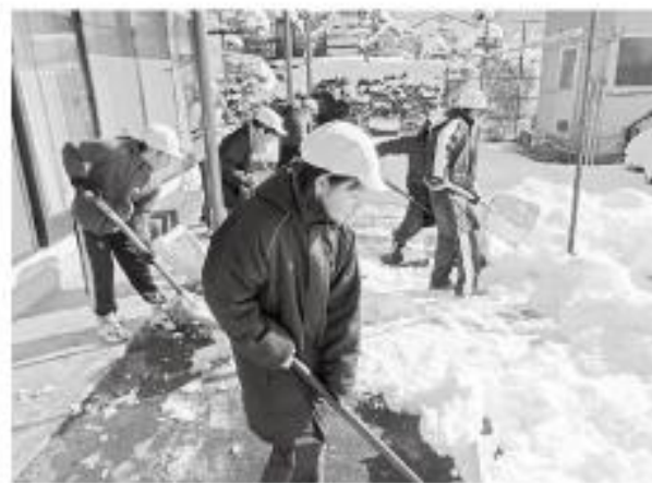
みんなで雪かきボランティア!!