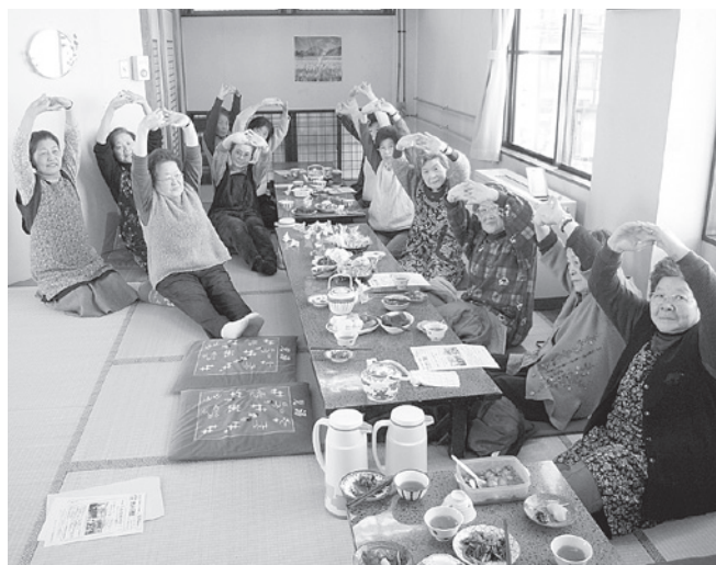
2区会場（遊泉ハウス児湯）