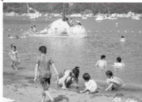
毎年、夏休みには、伊豆に海水浴へ行っています。