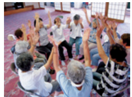
介護予防事業 健康増進教室

福祉に関する各制度が改正され、運営面でも厳しさがありますが、「誰もが住みなれた地域で、健康で安心して暮らせる町づくり」を進める組織としての共通認識を確認し、住民主体の地域福祉を推進していくため、事業に積極的に取り組んでまいります。