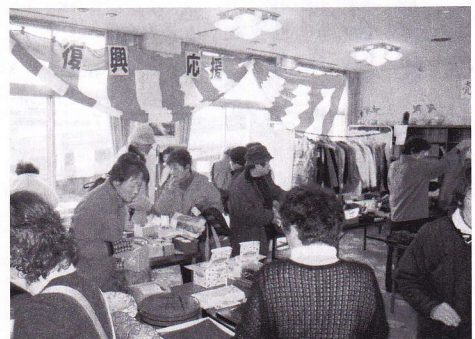
昨年のバザーの様子